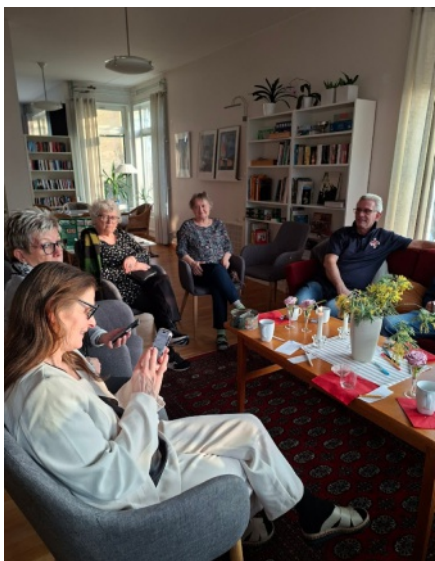
Förberelser för 8 mars i BIG Kornet i Mölndal.

På den frågan finns förstås inget självklart svar. Antagligen skulle de flesta säga att man inte firar alls. I BiG Kornet i Mölndal (där vi bor drygt 70 procent kvinnor) beslöt några av oss att i år ska vi uppmärksamma dagen! Under veckan innan söndagen den 8 mars satte vi upp information om viktiga kvinnor i historien på platser där de flesta i huset passerar. Själva firandet innehöll musik, sprillans nybakade bullar, kaffe, mimosablommor, ett quiz och dart. Och sen avslutade vi med filmen Suffragetterna. Vi hoppas att kvinnorna i historien som kämpat för det vi i Sverige i dag tar för självklart (exempelvis fri abort, att vara myndig oavsett civilstånd och rösträtt) hade känt sig hedrade!