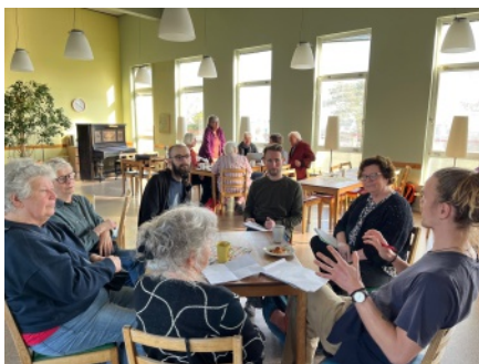
En rad samtal kring olika frågor pågick parallellt i Elfvinggårdens vackra matsal.