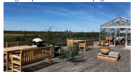
Bofællesskabet Grønne Eng på Amager har två takterasser med vid utsikt. På den större terrassen finns ett gemensamt växthus.