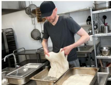
I Grønne Eng pågick bakningen av frukostbröd till söndagsfrukosten i ett av de gemensamma köken.