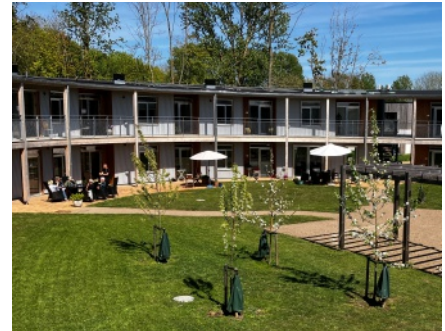
Ovalen, ett seniorbofællesskab med 59 lägenheter kring en gemensam gård. Här finns bland annat kök och mötesrum, verkstad, rum för kreativa verksamheter och gästrum. Och många sittplatser och ett växthus på gården.