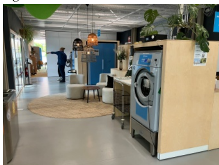
Kombinerad tvättstuga och mötesplats i HSB:s Living Lab.