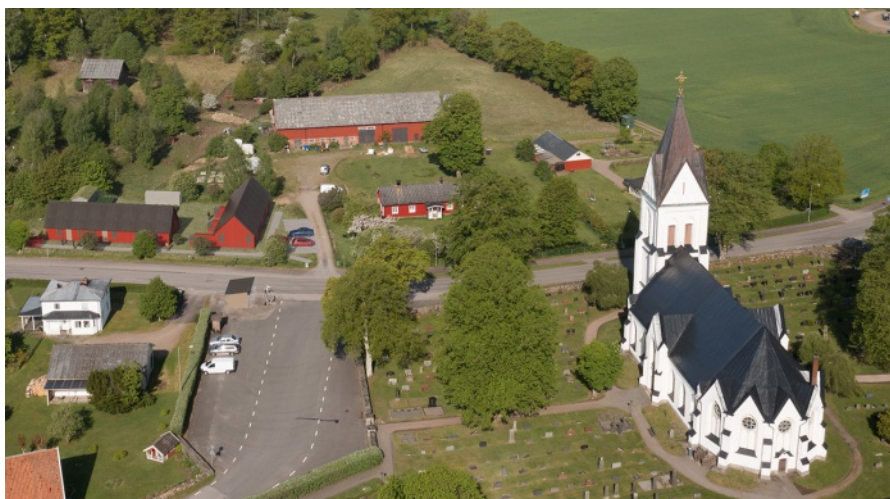
De två vinkelställda, rödmålade husen med svarta tak (till vänster på bilden) var tänkta för bygggemenskapen i Okome kyrkby, nordost om Falkenberg. Nu utvecklas projektet vidare. Idéskiss av Bärkraft & Byggnadskonst..

Stöd kan lämnas om minst sex medlemmar i bygggemenskapen, som är fysiska personer, betalat medlemsinsatsen på 10 000 kronor, och bygggemenskapen äger eller