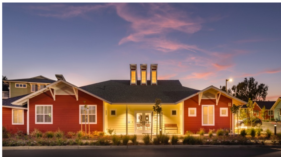
Det gemensamma huset i Valley View med gemensamt kök, matrum, lounge, datalabb, hobbyrum och toättstuga. Arkitekter The Cohousing Company