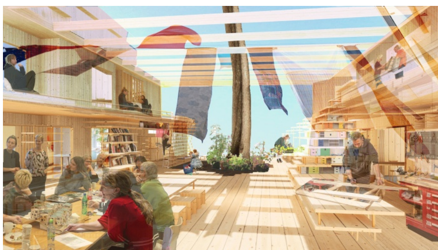
Inspirationsbild från biennalens hemsida. Rendering Helen&Hard.

Biennalen är sedan öppen till den 21 november i höst.