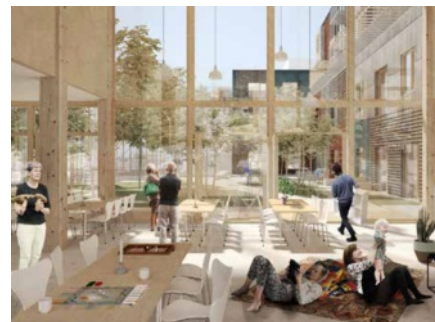
Perspektiv av ett gemensamt rum i bygggemenskapen i Køge Bukt. Inflyttningen börjar under 2021. Rendering Vandkunsten.

EN SPÄNNANDE MÖJLIGHET är en ny arbetsgrupp knuten till transport- och boligministeriet. I arbetsgruppen ingår bland annat ordföranden i Bofællesskab.dk. Arbetsgruppen har fått i uppdrag att göra det lättare att få till fler bofællesskaber genom att ta bort hinder och underlätta bland annat för det man kallar för "självgrodda" bogemenskaper,