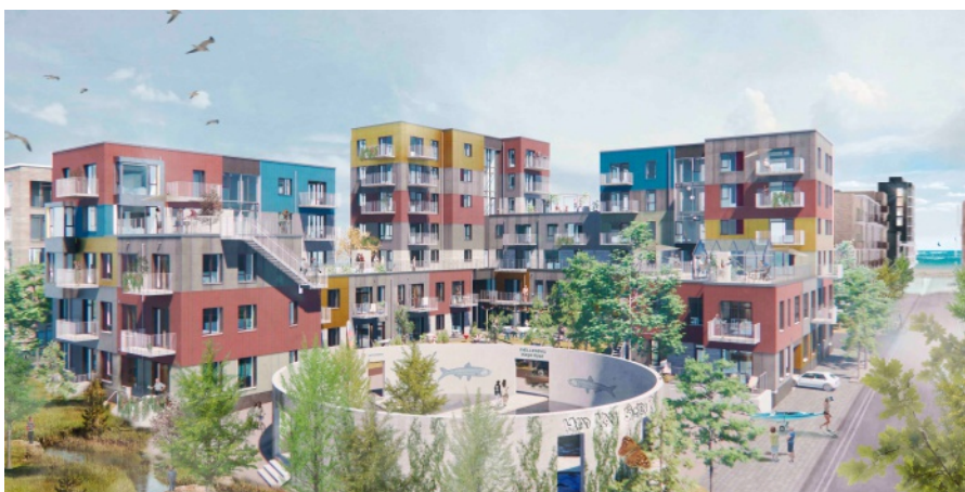
Perspektiv av den planerade byggemenskapen i Køge Bukt.