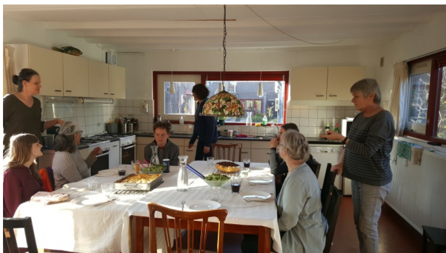
Gemensam måltid i ett av de tio klusterköken i Wandelmeent.

I DEN ANDRA DELEN av boken undersöker vi hur de ursprungliga idéerna bakom Wandelmeent fungerar i dag inklusive förväntade och väntade konsekvenser för den