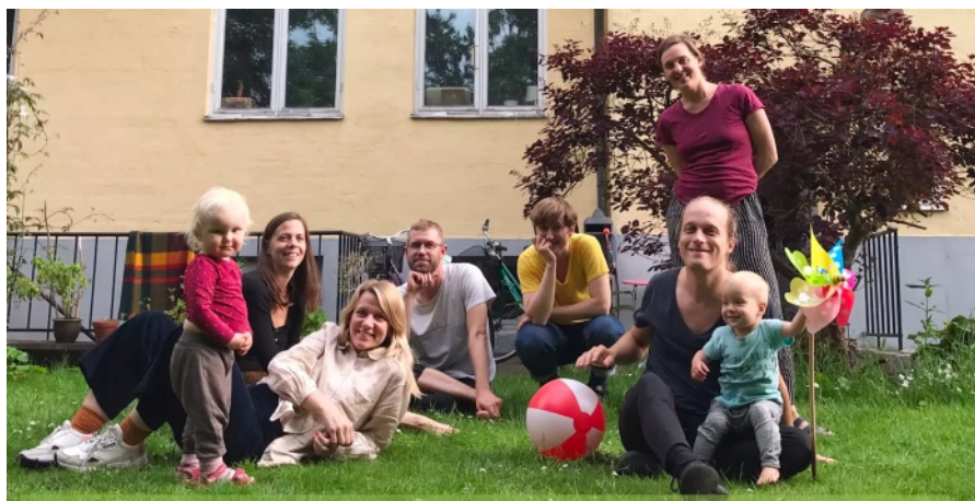
En mindre grupp på sex personer har drivit projektet som en bygggemenskap. Nu är det dags för de nya medlemmarna att komma med i processen.

https://kollektivhusetrodaoasen.com/ https://www.facebook.com/kollektivhusetrodaoasen/ https://divcity.se/s/Roda-Oasen.pdf