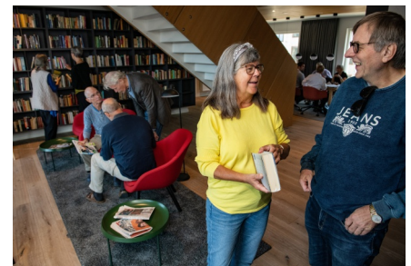
Trapphuset i Kamelia Hus är utformat som en del av de gemensamma lokalerna.

"Den här paradoxen medförde att Realdania satsade på att förändra attityderna i bostadssektorn och snabbstartade byggandet av nya seniorbogenskaper tillsammans med privata och allmännyttiga bostadsföretag. En insats som nu verkar ha burit frukt. Det finns utan tvivel många som