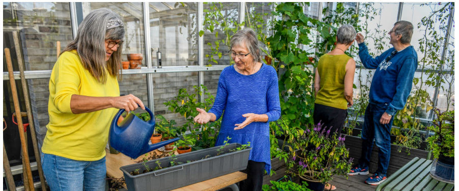
Kamelia Hus i Valby, Köpenhamn är ett nyinflyttat seniorbofællesskab. På husets takterrass finns ett gemensamt växthus. Huset är ett av tio med stöd av Realdania.

Trots ett stort intresse och långa köer till de bogemenskaper som finns, har byggandet av nya boge-