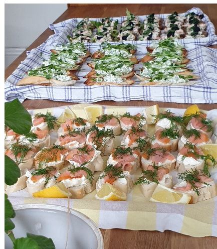
Inviingsnittarna, alla gick åt!