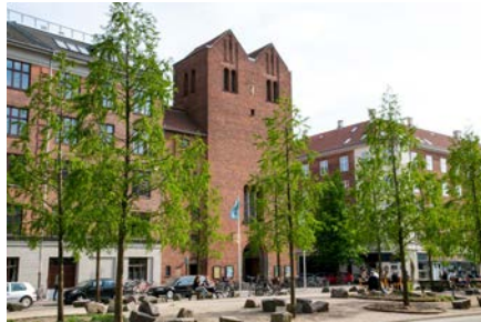
Folkehuset Absalon på Sønder Blvd i Köpenhamn. Den före detta kyrkan köptes 2012 av affärsmannen Lennart Lajboschitz och omvandlades till ett socialt rum för stadens invånare.

Kaffet är bland det billigaste i Köpenhamn och likaså är middagarna med enkel meny bland de