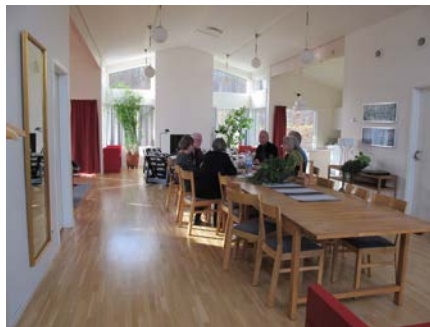
Lövsalen, det gemensamma rummet för måltider, fester, gäster och möten.