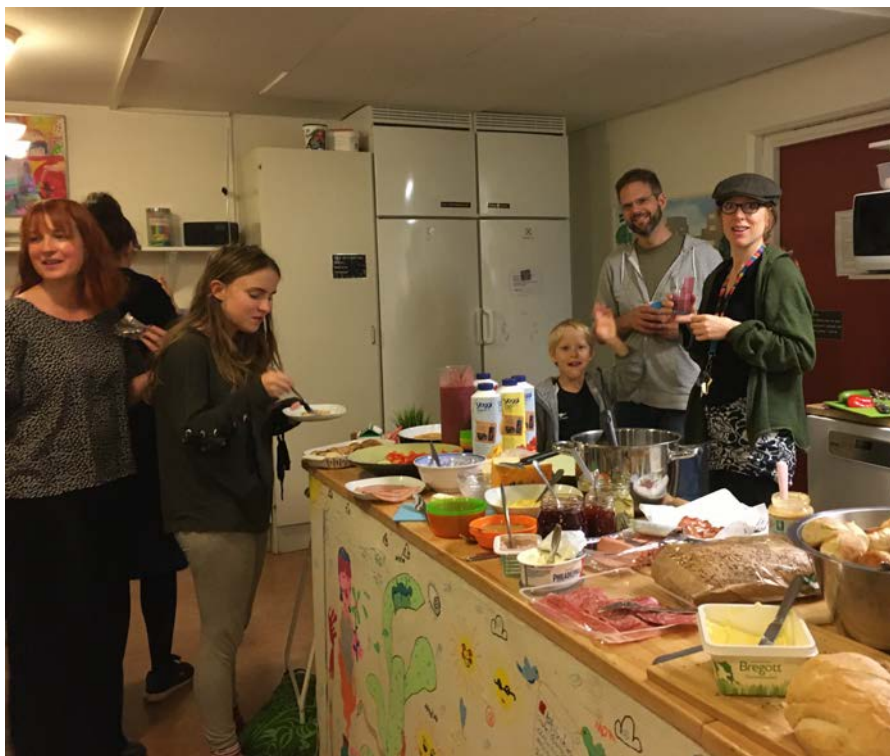
Söndagsbrunch i Stolplyckan, en av många gemensamma aktiviteter i kollektivhuset.

ler har en arbetsgrupp som initierar gemensamma aktiviteter och ansvarar för lokalen. Det finns också arbetsgrupper som ansvarar för vårt hönshus, odlingslotter, vår Stolpistidning, lastcykelpool och vårt stora grönområde.