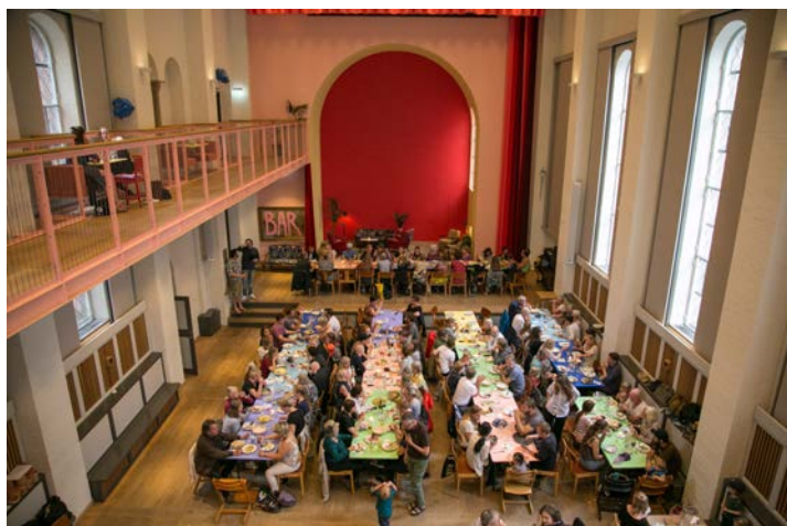
365 dagar om året har Folkehuset Absalon middagar för mer än 700 personer. Maten förbereds i Absalons kök och äts sedan i sällskap av åtta personer per bord.

FREDRIK WADENSTEN arkitekturstuderande KTH