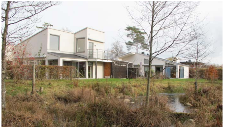
Bogemenskaper Botium i Växjö, ritad av Wibroe Arkitekter, består av 35 kedjehus och ett gemensamt hus. Botium är ett av de tio projekt som Helena Westholm studerat. De andra är Tersen i Falun, Lagnö Bo i Trosa, Hogslätts vänboende i Bohuslän, Sofielund och Urbana villor i Malmö, Under samma tak och Majbacken i Göteborg, BiG Kornet i Mölndal och Kopparslagaren i Hudiksvall.

De problem som kommer fram i intervjuerna är inte okända för denna tidnings läsare. Det handlar om