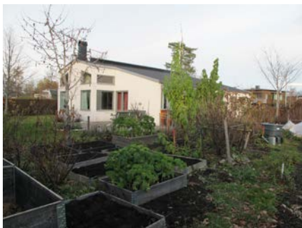
Nästan all mark i Botium sköts gemensamt, till exempel odlingen utanför Lövsalen.