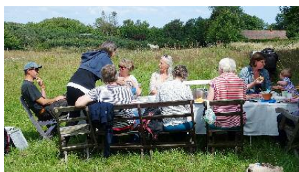
Knyttis på tomten för den kommande ekobyen i Baskemölla.

Som namnet antyder finns det sedan tidigare tre etapper i ekobyen som ligger nära fiskebyn på Österlen med samma namn och ett stenkast från havet. Planen 2006 var att fortsätta utbyggnaden och en detaljplan upprättades. Något bygge blev