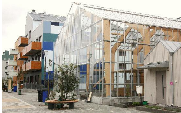
Ett av felleshuset i kvarteret Integralen. Huset ligger direkt mot huvudgångstråket och är gemensamt för alla som bor i kvarteret. Arkitekt Omniplan.

Felleshuset är tyvärr inte färdiga, flera är under byggnad, andra används som