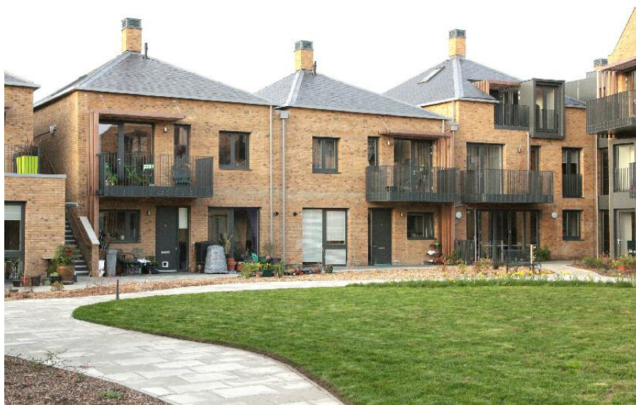
Den gemensamma gården i New Ground Cohousing (OWCH). Hit väntar alla lägenheter och balkonger.

Det var svårt att få lån och svårt att få banken att förstå meningen med gemensamma lokaler. Motionsrum och mycket annat