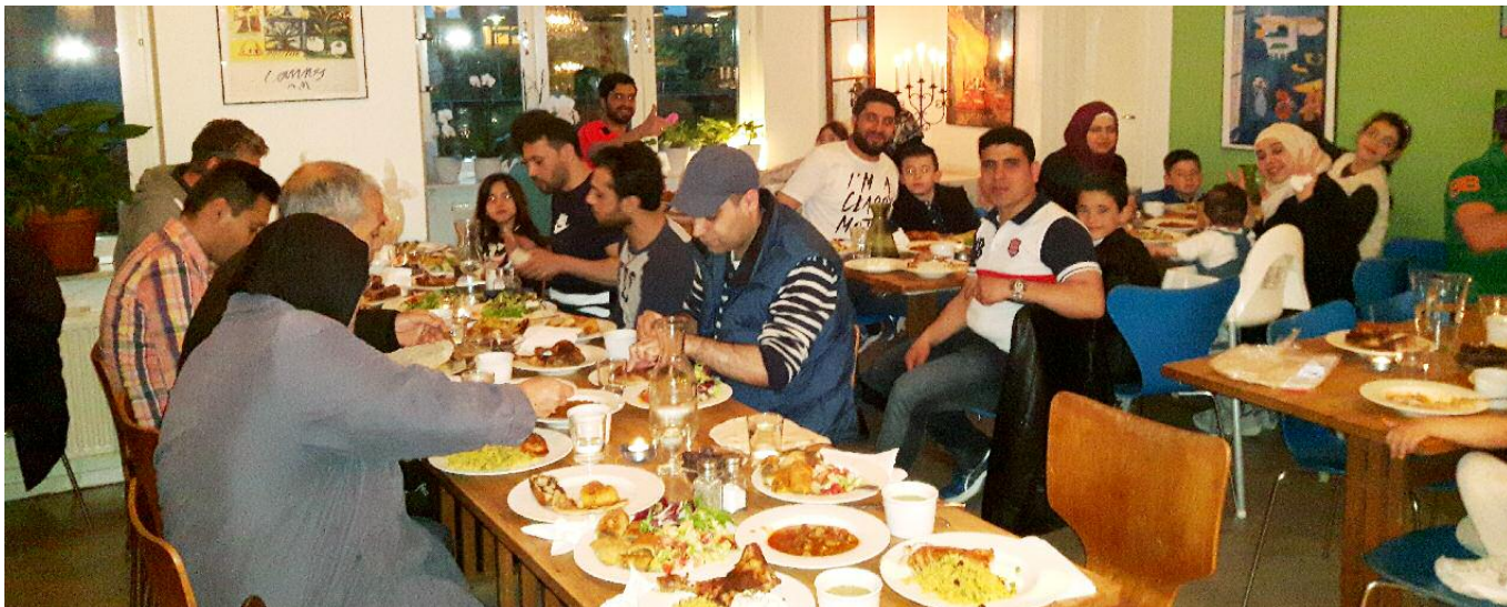
Middag i Tullstugan i juni i år för nyanlända från Vintertullen.