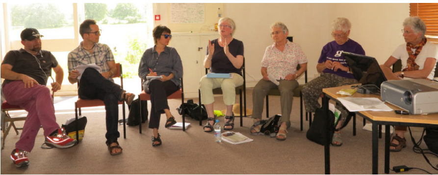
Från CoElderly-projektets möte i Laughton Lodge i Lewes. Till vänster de italienska deltagarna och till höger medlemmar i Old Women's Cohousing Group, som håller på att förverkliga ett kollektivhusprojekt i London.