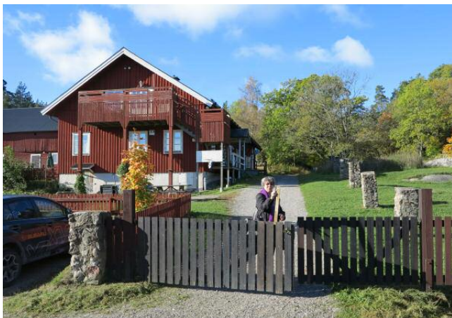
Huvudbyggnaden på Lagnö gård med daghem och vandrarhem. Medlemmarna bor utspridda i småhus i den kuperade terrängen.