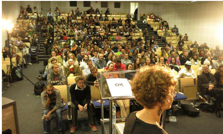
Konferensen i Łódź lockade människor i alla åldrar och från många yrken. Tal och diskussioner simultantolkades mellan polska och engelska.