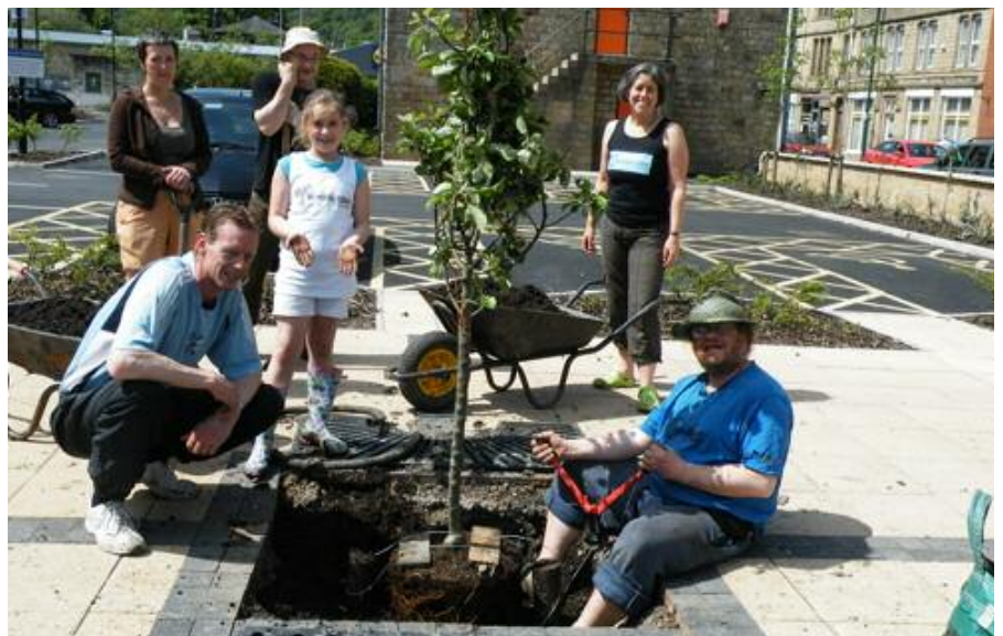
Missa inte ett besök på Tormodens hemsida: www.incredible-edible-todmorden.co.uk/ (notera parollen »det otroliga ätbara«)