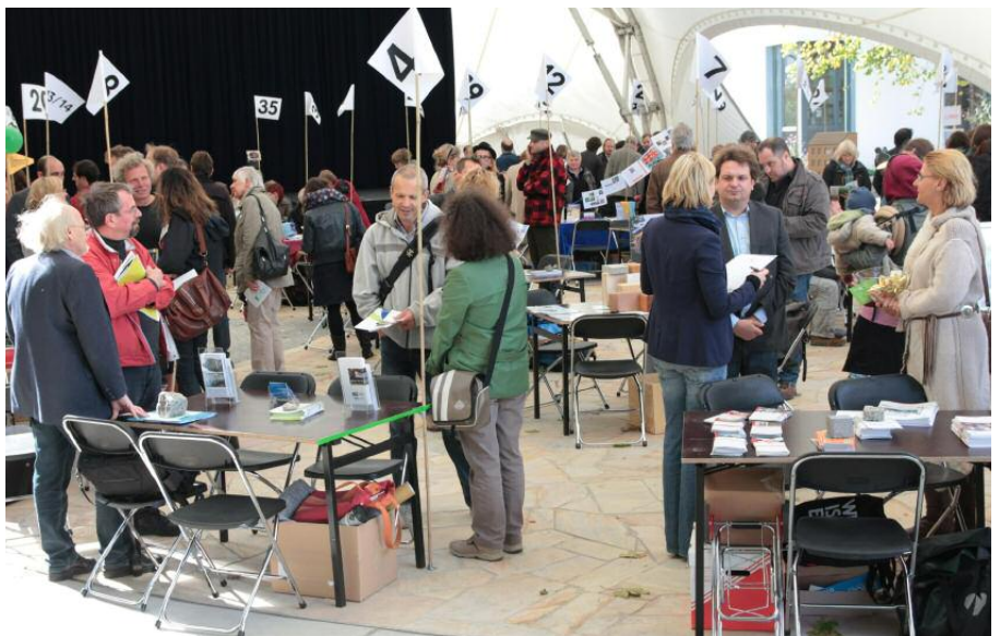
Experimentdays 2012 i Berlin.

Ett av de exempel på 'cohousing' vi fick presenterat handlade om St Petersburgs förstadsområden med sina höga skivhus från Sovjettiden. Där förfogar de boende enbart över en 5–10 meter bred remsa närmast husen, resten sköts av myndigheterna. En grupp aktivister såg små embryon till dekorationer i remsan, och lyckades efter hand skapa en gemenskap mellan