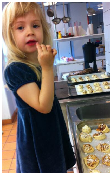
Alma i kollektivhuset Södra Station bakar bul-lar till Öppet hus då huset också firade 25 år.

De flesta husen satsade på kafé och visning av huset, men vissa visade också till exempel konsthantverk eller film. Besöksantalet varierade stort, från 10-12 personer till över 50. Många har svårt att nå ut med information om det öppna huset till tidningarna, det verkar som om man kan behöva ringa ett par gånger för att få in informationen i kalendrier. Några valde att ha öppet hus en annan dag än första helgen i oktober, och det verkar ha fungerat lika bra, eftersom inte heller Kollektivhus NU når ut med någon samlad information i media.