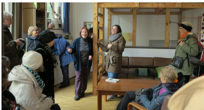
Gemensamhetslokalen i Max B.

Läs mer på: www.lmbhh.de/Hausgemeinschaft-Max-B.434.o.html