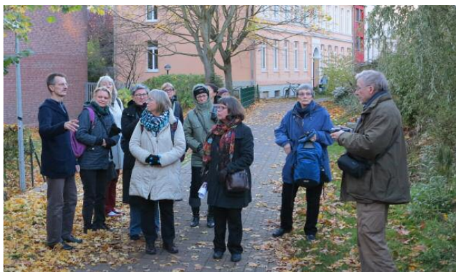
Rundvisning i Greves Garten. Läs mer på http://www.greves-garten.de .