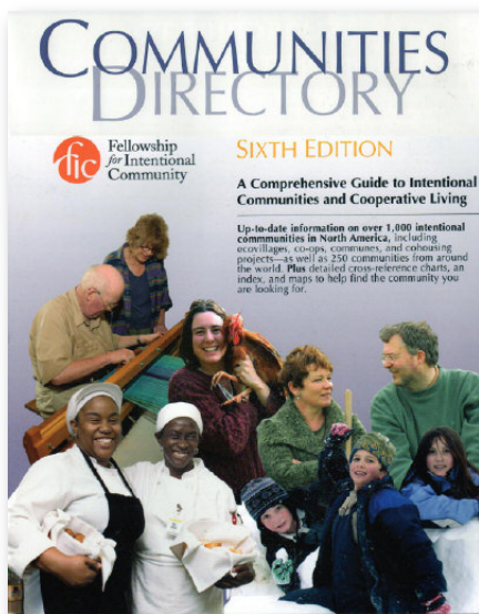
FICs sjätte katalog över avsiktliga gemenskaper.

Kollektivhusen ingår i det vidare amerikanska nätverket FIC, Fellowship for Intentional Community ( www.ic.org ). Begreppet kan översättas med »avsiktig gemenskap«, det vill säga ett kollektiv som avviker från den traditionella släkt- eller bygemenskapen genom att man inte föds in i den utan