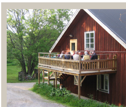
Middag på vandrarhemmets veranda.

Vi tänker oss ett hus med kanske 10–12 lägenheter, två–tre rum och kök, stor trädgård, gärna både inne och ute, anpassat för att byggas på landsbygden. Vi tänker oss ett hus som vi äger och förvaltar till exempel kooperativt eller på annat sätt gemensamt. Vi tänker oss ett hus för boende, inte för att