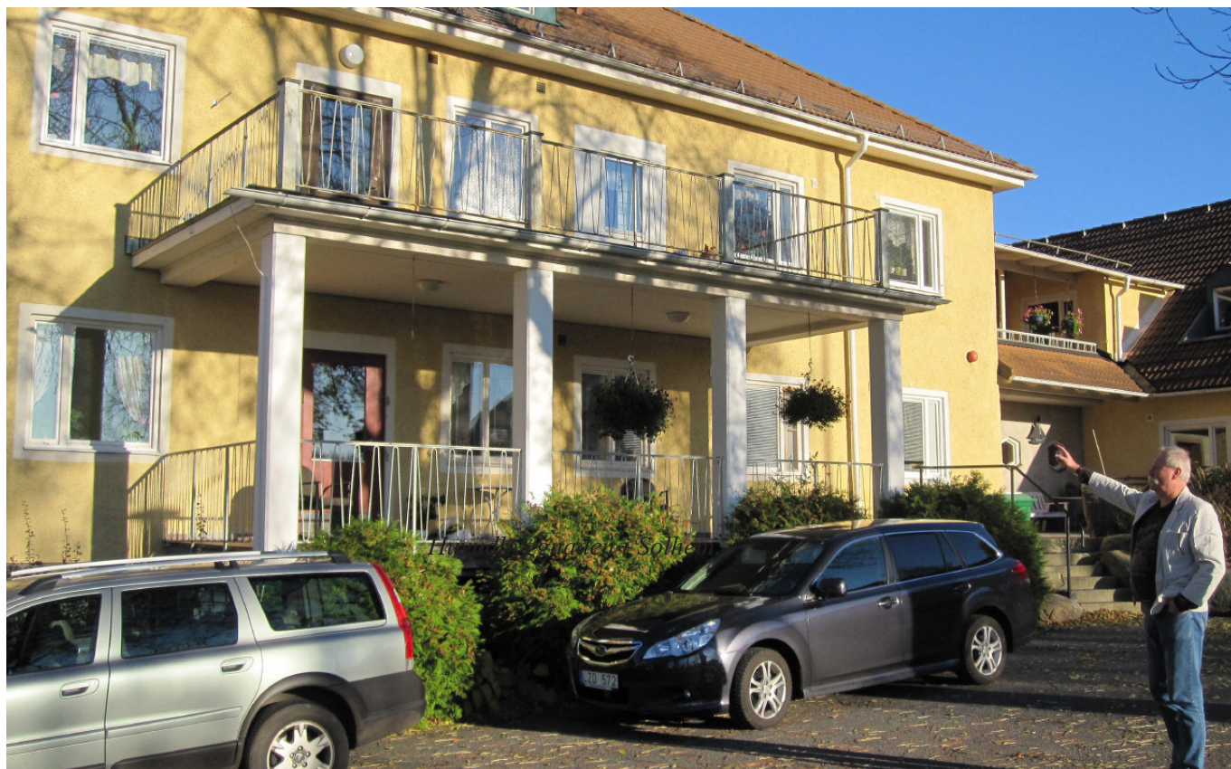
Huvudbyggnaden i Solhem.