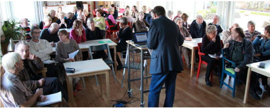
Dunderbackens matsal passade utmärkt för seminariet »Schyssta villkor«.