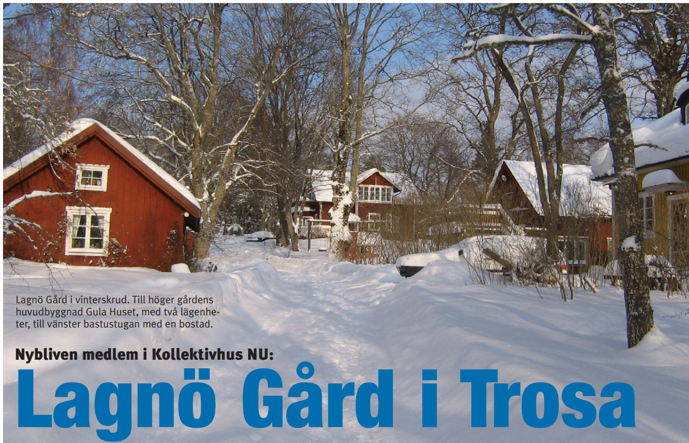
Lagnö Gård i vinterskrud. Till höger gårdens huvudbyggnad Gula Huset, med två lägenheter, till vänster bastustugan med en bostad.