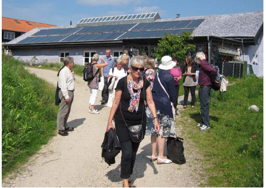
Styrelsen på besök i Munksögården.