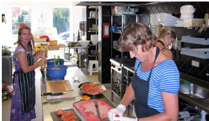
I Lange Engs kök lagas 140 portioner sex dagar i veckan.