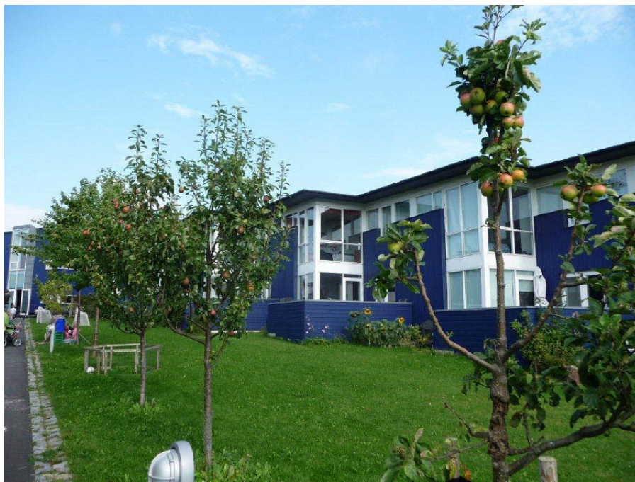
Radhusen i Absalons Have.

Ekologisk hållbarhet står som ett överordnat mål för kollektivhusföreningen. Som exempel använder gemensamhetshuset enbart förnyelsebar energi och svanmärkta