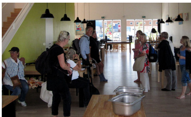
Måndag till fredag kan man äta i matsalen.