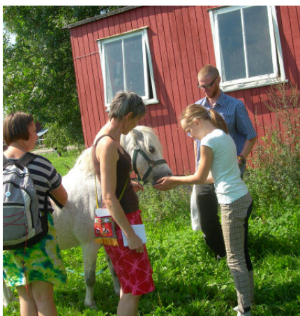
Ett av alla klapp- och keldjur.

vagnstall samt verkstäder. Gården ägs av en andelsförening och sköts under året av en grupp som väljs på föreningens årsmöte.