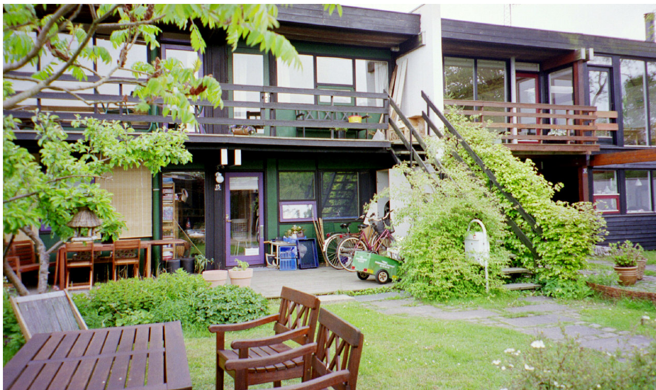
Sættedammen, ett »bofælleskab« i Danmark som byggdes i början av 1970-talet.