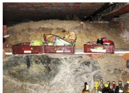
Jordkällare med backar för matlagen.