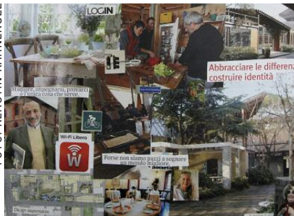
Exempel på en »moodboard« som illustrerar stämningar i ett kollektivhus för äldre.

En annan del av metoden går ut på att dela ut färdiga inplastade ark med bilder som illustrerar olika aspekter av bogemenskap och låta gruppen diskutera vilka som är mest önskvärda. En större grupp kan dela upp sig i mindre (4–6 personer i varje) så att alla kan delta utan hämningar. Arken fördelas på a) de som alla stöder, b) de om ganska många stöder och c) de som bara ett fåtal stöder. På grundval av de upphängda arken kan hela gruppen sedan diskutera vilka önskemål som kan komma i konflikt med varandra (till exempel husdjur och allergifri miljö, eller viljan att tjäna tid mot önskemål om många gemensamma aktiviteter) och vilka som lätt kan förenas (som vardagsstämning och sal för privata fester, eller gemensam städning och låga bostadskostnader).