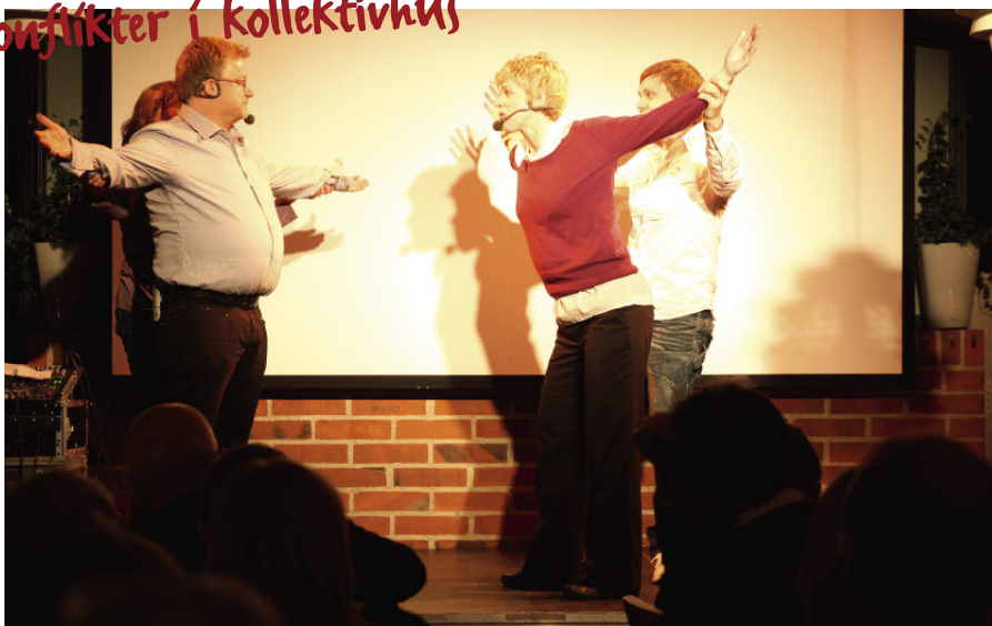
Vid konferensens festmiddag illustrerade Stockholms improvisationsteater konflikter i bogenenskap på ett dråpligt sätt.