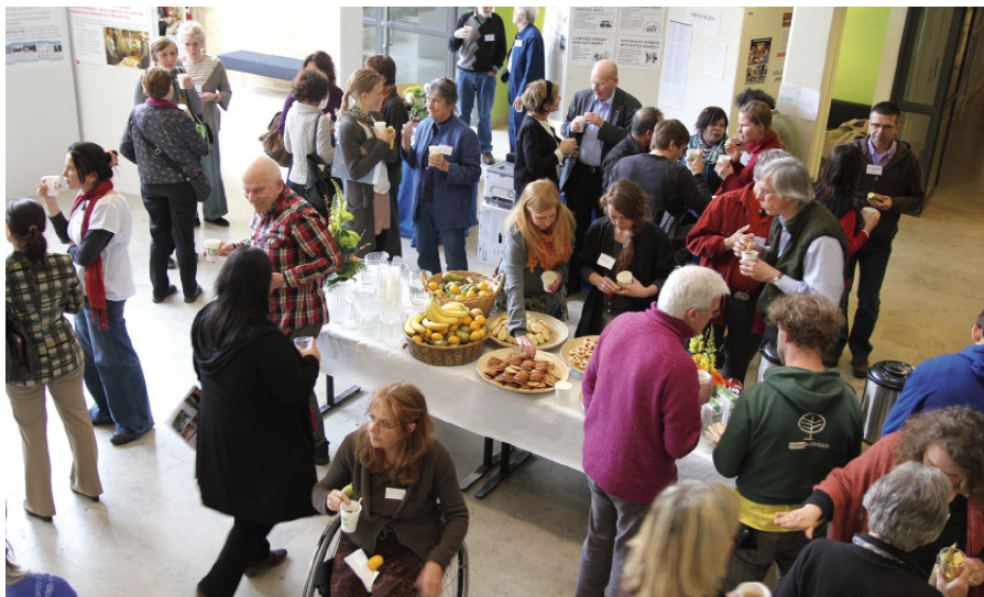
Fikapauserna hörde till det som var mest uppskattat på den internationella konferensen.