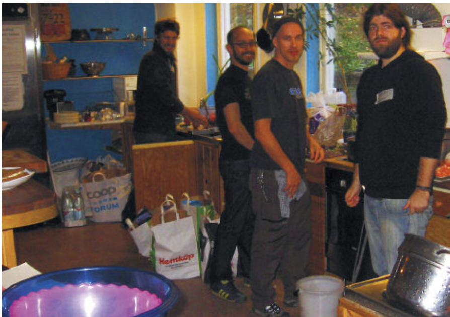
Köket i Stockholms hems kollektivhus Cigarrlådan, Hökarängen.