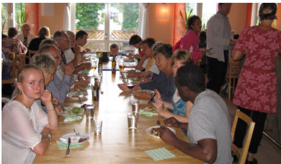
Matsalen i Vildsvinet.