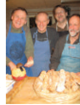
Kockar i Tullstugan i Stockholm.