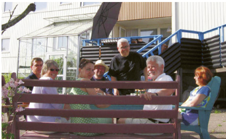
Tunnan i Borås hade över 100 besökare (bilden från ett tidigare tillfälle).