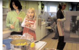
Barnmatlag i Södra Station, Stockholm. Vård: Svenska Bostäder