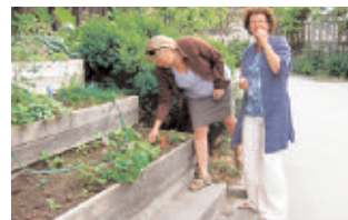
Odlingar i Fullersta Backe, Huddinge. Vård: Huga Fastigheter AB