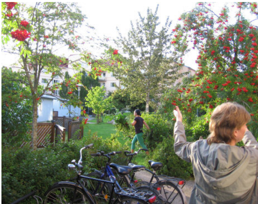
Den prunkande trädgården.

Vi hade rätt att ha 6-7 hönor. Det var inte vinterbonat i början. Vi gav bort eller leasade höns. Det var dvärghöns och sist Hedemorahöns. Det flesta tycker det är roligt med hönsen, särskilt barn. Ibland på sommaren har det väl klagats på att tuppen låter för mycket. Ett år hade vi ingen tupp,