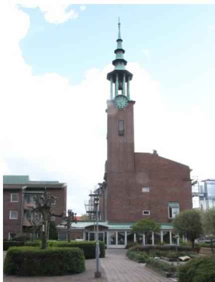
Tornhuset, den gamla fabriksbyggnaden med sitt klocktorn innehåller i dag gemensamma lokaler. Till vänster syns den första bostadsdelen.