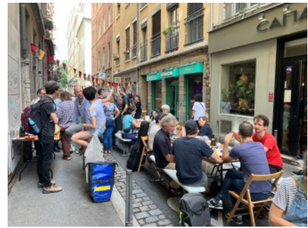
Hela gatan stängdes av när bogemenskapen Au 26 le Canut (det gula huset i mitten) firade sina första fyrtio år.

Arbetet fortsatte senare med att isolera fasaderna, bygga en gemensam mångsidig samlingslokal och göra i ordning tomten. Mycket skedde tillsammans med frivilliga