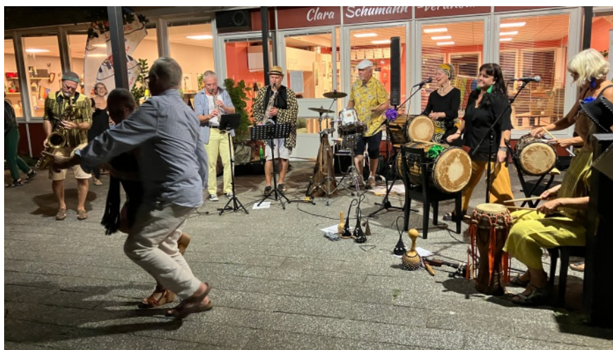
Kaxyphonic med fyra saxofoner, en virveltrumma och fyra afrikanska trummor fick många att dansa.