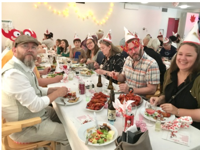
Kräftskiva i Stolplyckan.