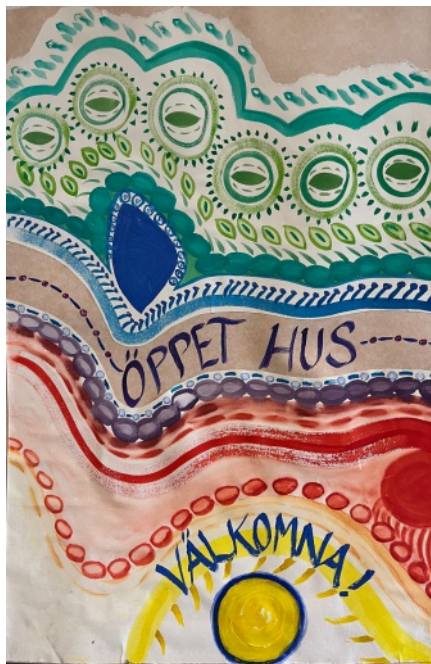
Affisch som välkomnade besökare till Tersens öppna hua 2023.