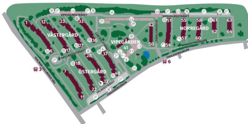
Plan över bebyggelsen i Thulehem med Vipegården i mitten. Här finns områdets restaurang och samlingslokaler. Källa thulehem.se.

Det utmärkande med Thulehem är att här har utvecklats en kultur som i hög grad uppskattas av majoriteten boende. Helt klart hänger det samman med de goda förutsättningar för samvaro och samverkan som de gemensamma lokalerna och inrättningarna ger. Viktigast är nog