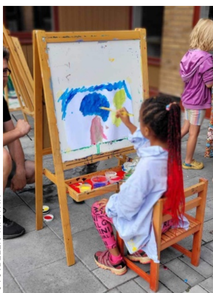
Utomhusmålning för barnen i Stolplyckan