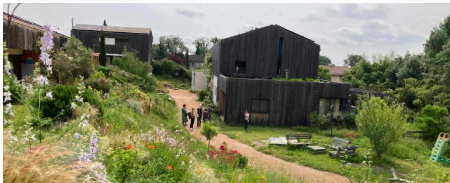
Le Coteau de la Chaudanne. Till vänster seniorlägenheter, rakt fram det gemensamma huset och till höger ligger familjelägenheterna.

I Frankrike finns nästan 700 gemenskapsboenden av olika slag – byggemenskaper, bogemenskaper, ekobyar, community land trusts, tiny houses etcetera. De har ofta färre lägenheter än kollektivhus i Sverige, mellan 5 och 15. En femtedel är byggda i samarbete med den franska allmännyttan, HLM. Nä-