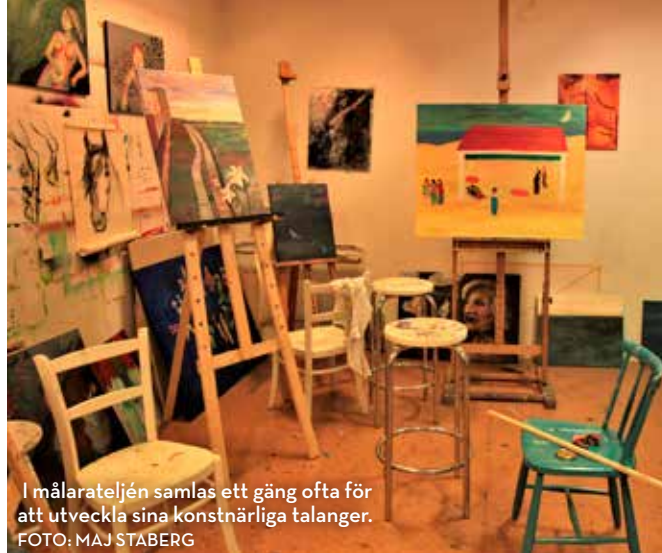
I målarateljén samlas ett gäng ofta för att utveckla sina konstnärliga talanger.

sällskapsrum, tv-rum och ytterligare några rum. Speciellt keramikverkstaden är populär. Den byggdes då huset var nytt, och kollektivets boende har för tredje gången haft tillfälle att gå en kurs med en professionell keramiklärare.