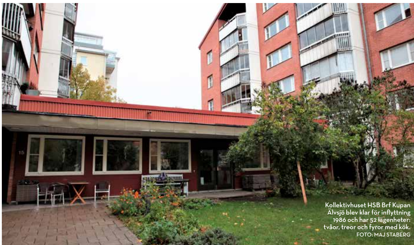
Kollektivhuset HSB Brf Kupan Älvsjö blev klar för inflyttning 1986 och har 52 lägenheter: tvåor, treor och fyror med kök.

lokalerna oftast mest av barnen. I de som är för 40+ finns många vuxna med gott om tid för vuxengemenskap, som daglig fikastund och studiecirklar.