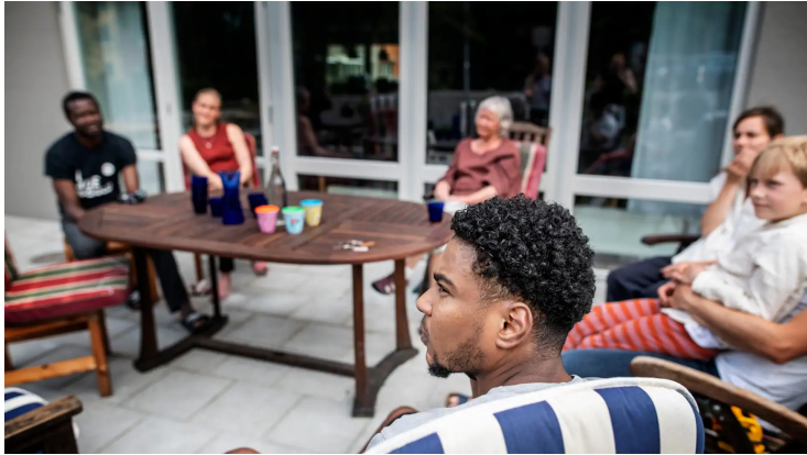
Grannarna har haft vissa gemensamma aktiviteter utomhus under våren. Middagarna i den stora matsalen får vänta tills coronaepidemin är över.

– Framför allt hade jag många vuxna förebilder, utöver mina föräldrar. Det vill jag att mina barn också ska ha, säger hon.