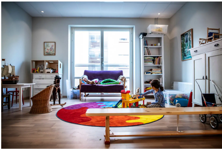
Barnen har fått ett gemensamt lekrum i kollektivhuset i Högsbo.

Byggemenskaper anses av förespråkare bidra till en mångfald på bostadsmarknaden, genom att bostäderna utformas utifrån privatpersoners egna önskemål. Drivkraften kan exempelvis vara att vilja ha mer kontakt med sina grannar, att ha ett boende med mindre klimatpåverkan eller att vilja flytta ihop med en grupp vänner.