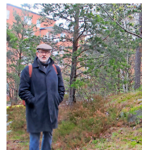
På plats. Den här kullen vid station är framtida boplat