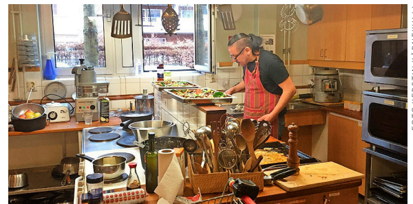
Kök. I kollektivhuset Tre Portar i Skarpnäck fixas brunch i köket. Kombo har hämtat inspiration från andras kök.