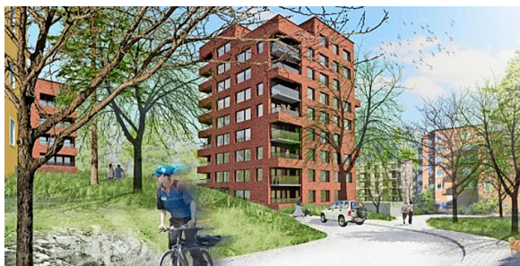
Vision. Så här skulle huset kunna se ut när det är klart. Tyréns är arkitekterna bakom och Skanska ska bygga.